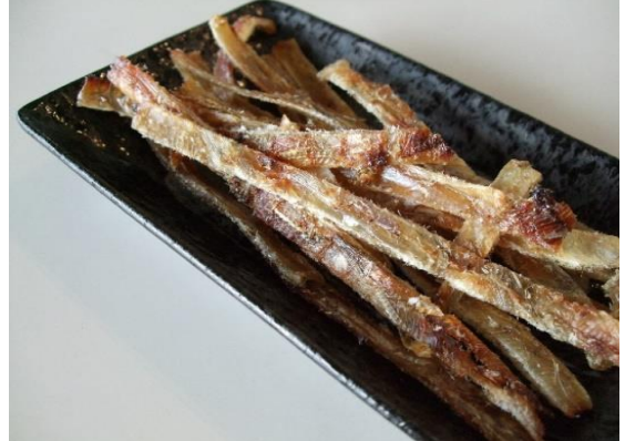
イワシのみりん干し 800円 (税込 880円)