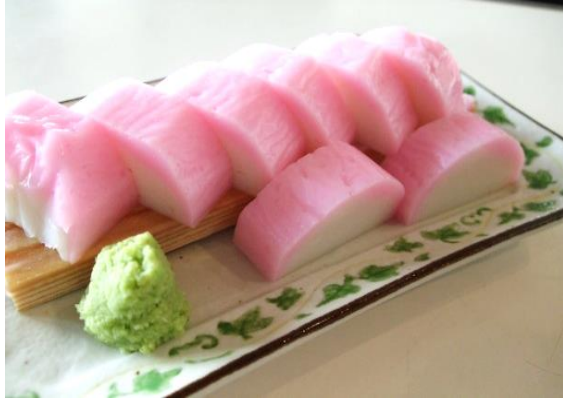
板わさ 800円 (税込 880円)