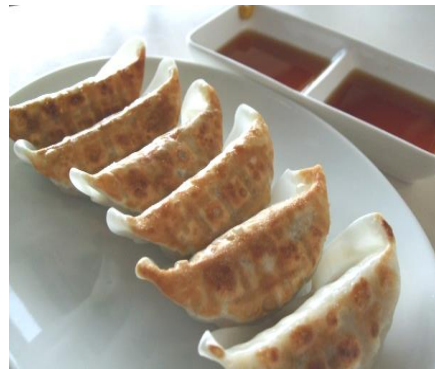
焼きギョーザ(6個) 800円(税込 880円)