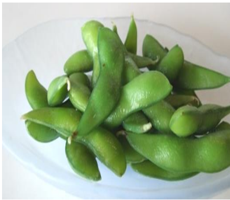
枝豆 800円 (税込 880円)