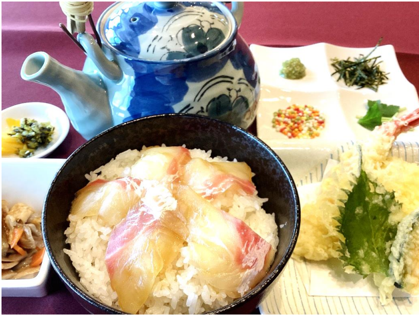
鯛茶漬け 2,000円 (税込 2,200円)