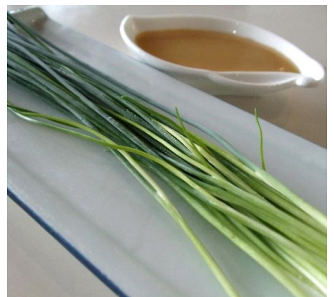
こうとうねぎ 鴨頭ネギ 800円 (税込 880円)