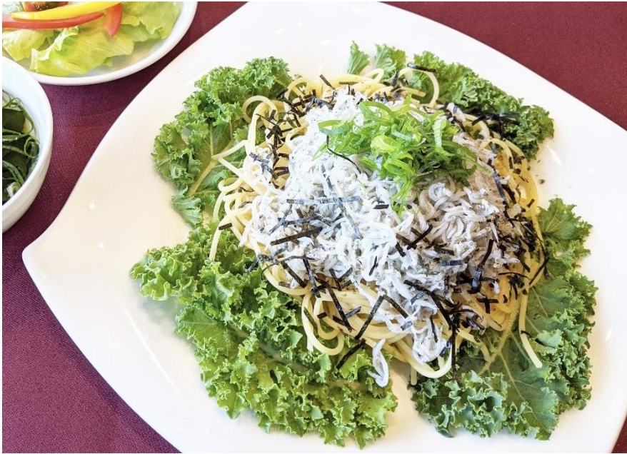
しらすパスタ 1,800円 (税込 1,980円)