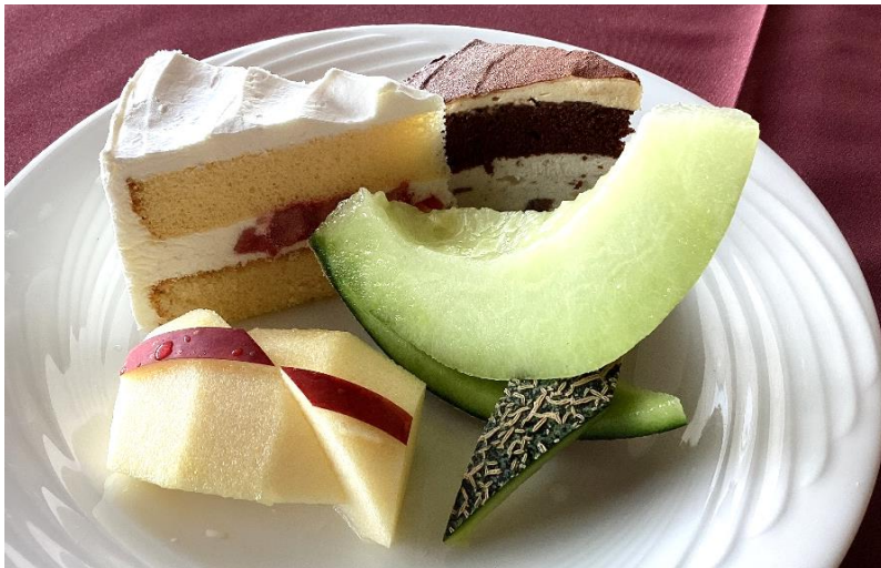
ケーキセット 1,000円(税込1,100円)