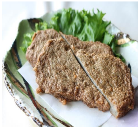
じゃこ天(宇和島産) 800円 (税込 880円)