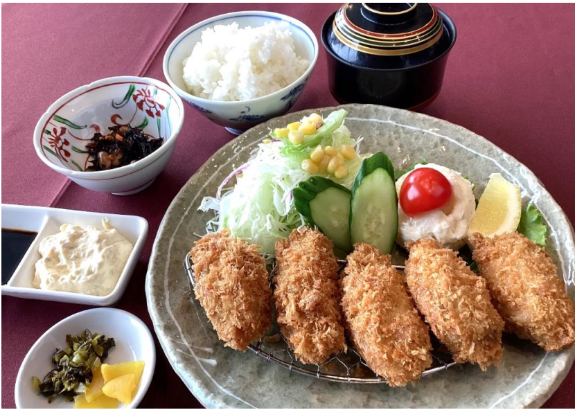
カキフライセット 1,900円 (税込 2,090円)