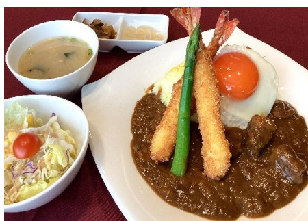
エビフライカレー 2,300円(税込 2,530円)