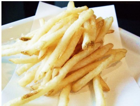
フライドポテト 800円(税込 880円)