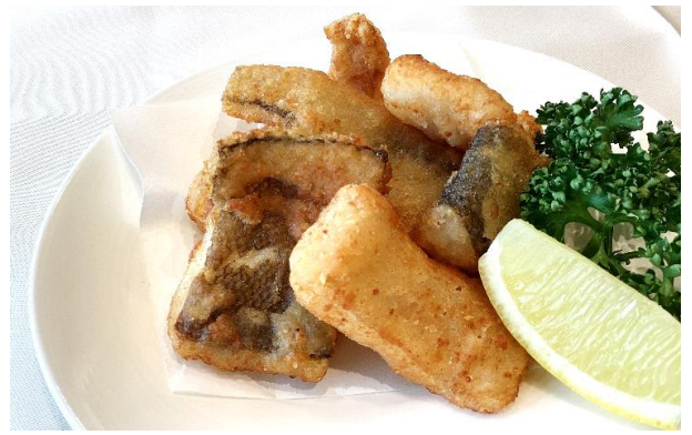
骨抜きカレイの唐揚げ 1,000円 (税込 1,100円)