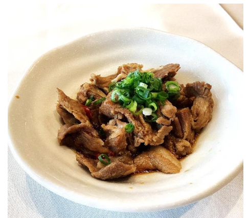
牛筋ポン酢 800円 (税込 880円)