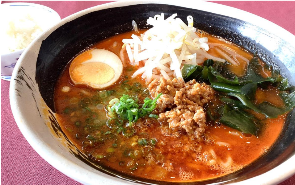
担々麵 1,500円 (税込 1,650円) (ごはん付き)