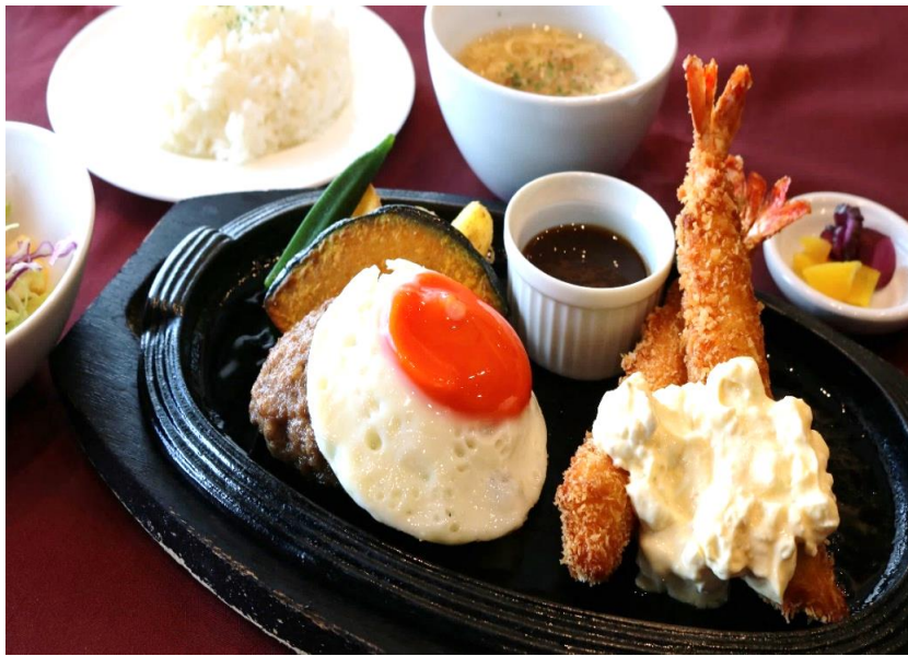
エビフライ・ ハンバーグセット 2,200円 (税込 2,420円)