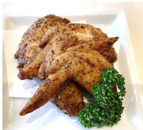
スパイシー手羽唐 1,000円 (税込 1,100円)