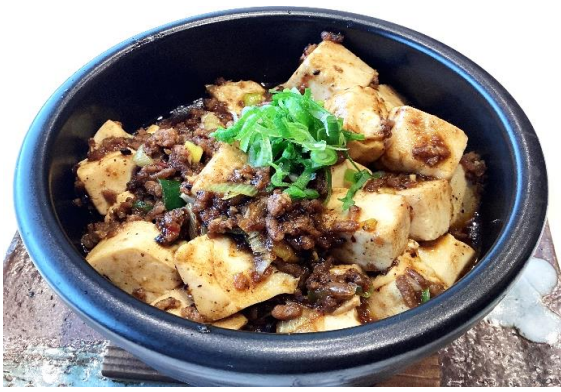
麻婆豆腐 1,200円 (税込 1,320円)