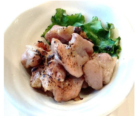
カモの炭火焼き 800円 (税込 880円)