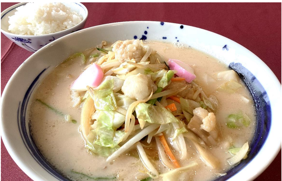
ホルモンちゃんぽん 1,800円 (税込 1,980円) (ごはん付き)