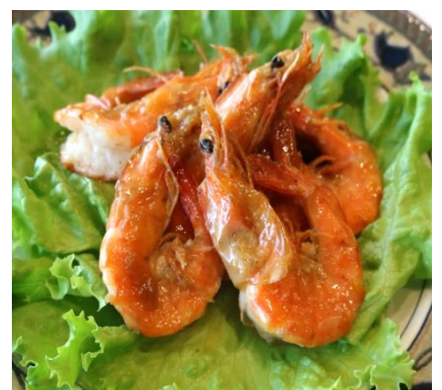
ガーリックシュリンプ 1,000円(税込 1,100円)