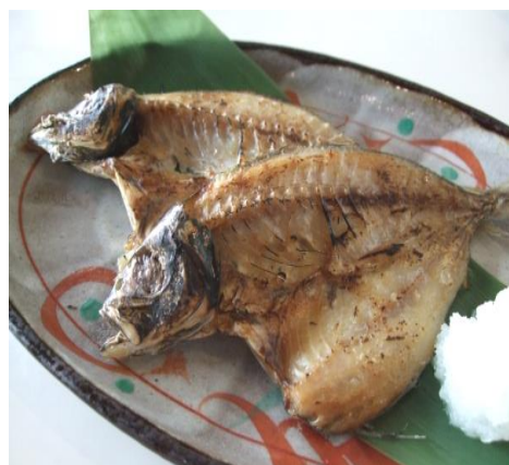
アジの一夜干し(2枚) 1,000円(税込 1,100円)