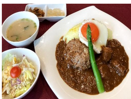
ハンバーグカレー 2,300円(税込 2,530円)