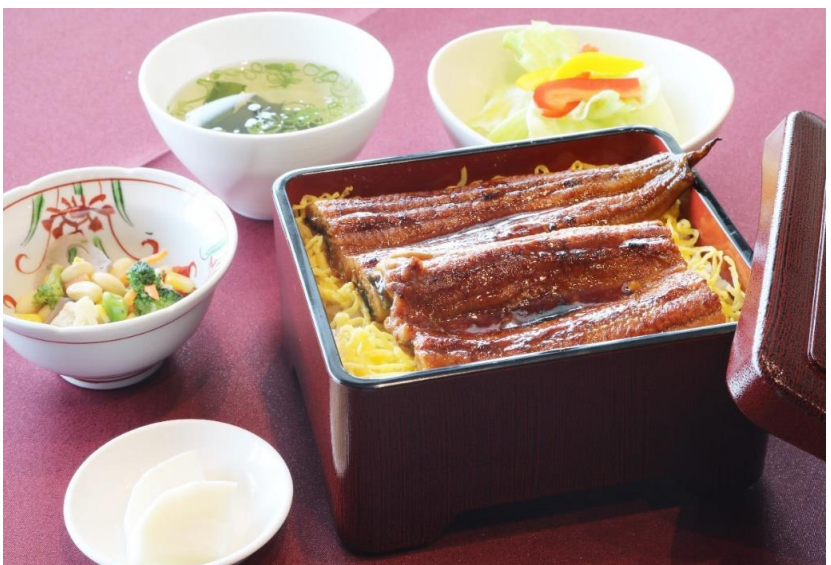
うな重 3,000円(税込 3,300円)