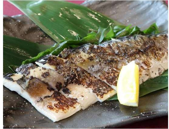
しめ鯖の炙り 1,000円(税込 1,100円)