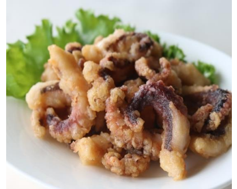
たこの唐揚げ 1,000円(税込 1,100円)