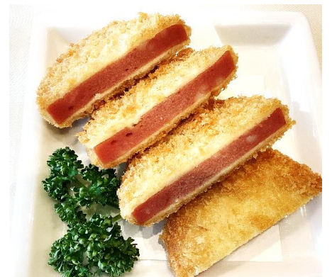
ハムカツ 900円 (税込 990円)