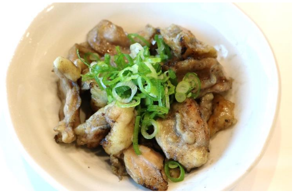
鶏ハラミ焼き 800円 (税込 880円)