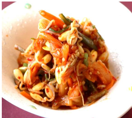
キムチナムル 800円 (税込 880円)