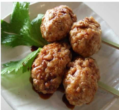
鶏つくね(2串入り) 800円 (税込 880円)