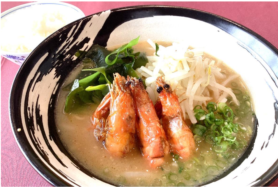
海老味噌ラーメン 1,700円 (税込 1,870円) (ごはん付き)