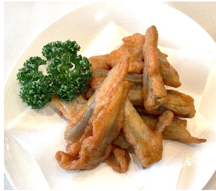
ごぼうとすり身揚げ 800円 (税込 880円)