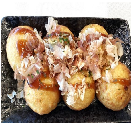
揚げたこ焼き 800円 (税込 880円)