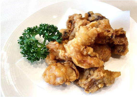
いか軟骨の唐揚げ 1,000円 (税込 1,100円)