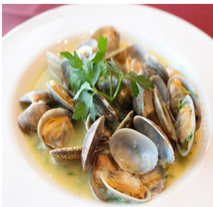
あさりバター焼き 900円(税込 990円)