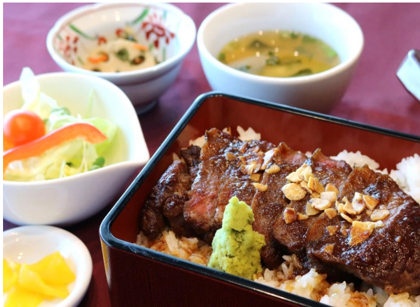
ステーキ重 2,500円(税込 2,750円)