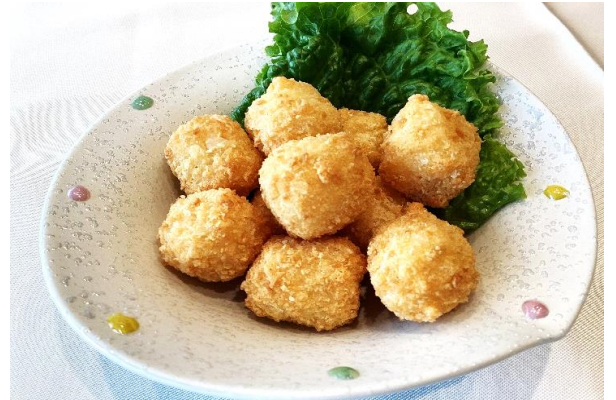
チーズボール揚げ 900円 (税込 990円)