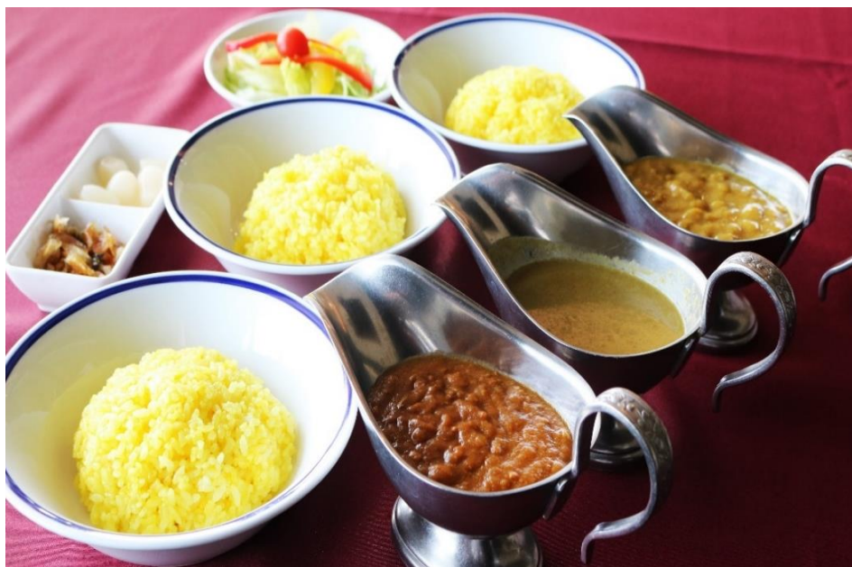
3色カレー 2,000円(税込 2,200円) (キーマ・グリーン・ビーフ)