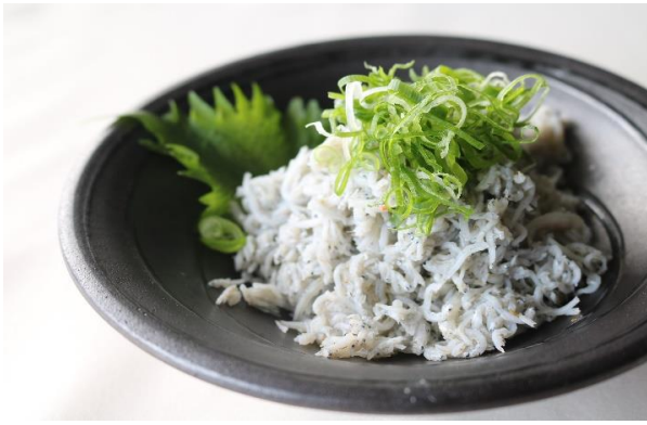
釜揚げしらす(愛媛県産) 800円(税込 880円)