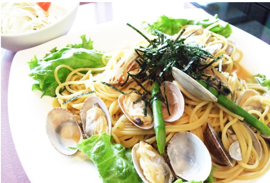
あさりのボンゴレパスタ 1,800円 (税込 1,980円)