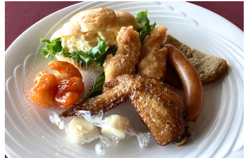
おつまみセット 1,000円(税込1,100円)