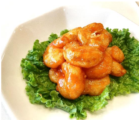
エビチリ 1,000円 (税込 1,100円)