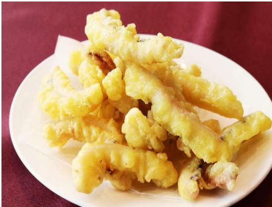
さきいか天 1000円(税込 1100円)