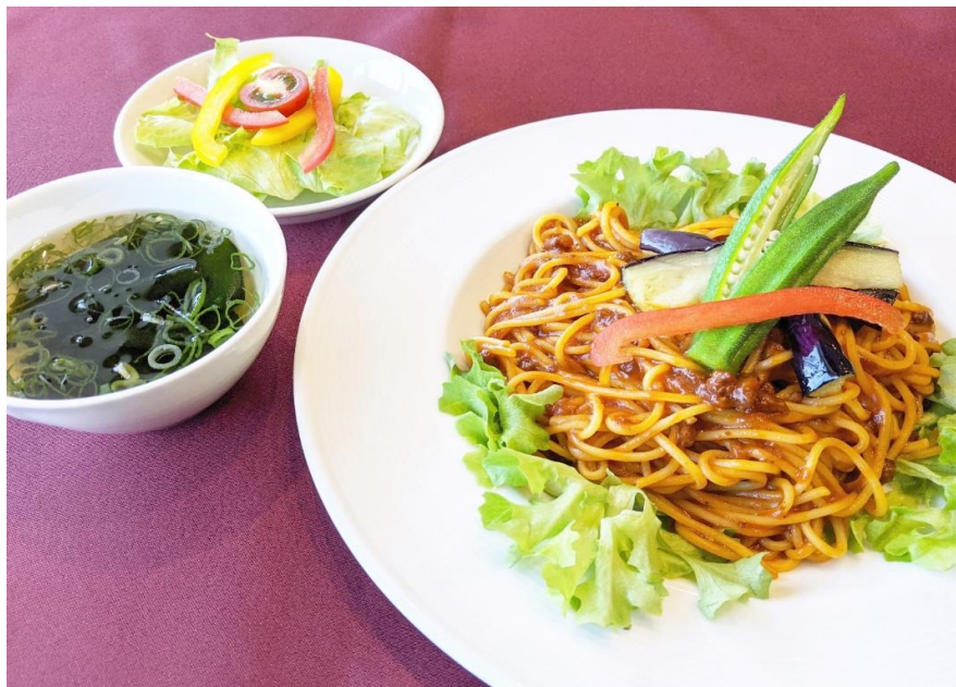
ミートスパゲッティ 1,800円 (税込 1,980円)