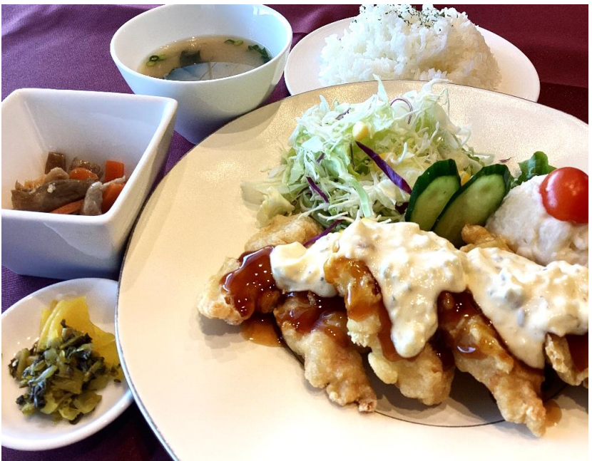
チキン南蛮 1,600円 (税込 1,760円)