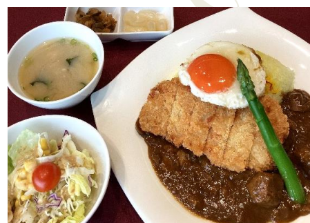
カツカレー 2,400円(税込 2,640円)