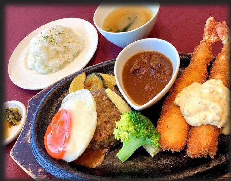
エビフライ ハンバーグセット 2,200円 (税込 2,420円)