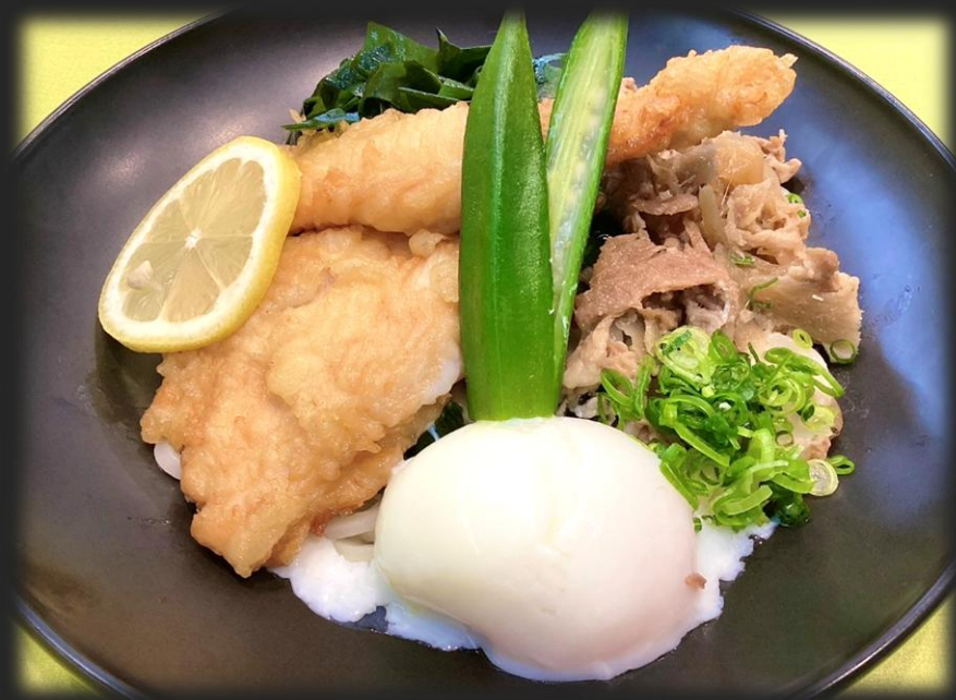
とり天ぶっかけうどん 1,800円 (税込 1,980円)