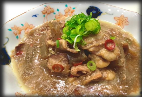
牛モツ煮込み 900円(税込 990円)