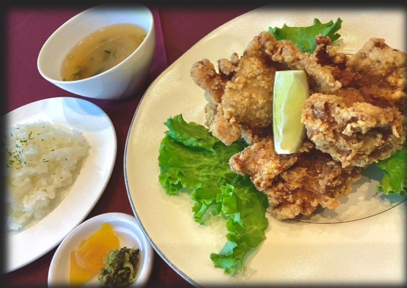
からあげ定食 1,800円 (税込 1,980円)