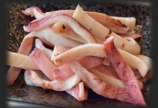
いか焼き 1,000円(税込 1,100円)