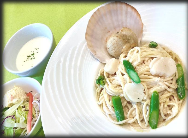
ホタテのクリームパスタ 1,800円 (税込 1,980円)