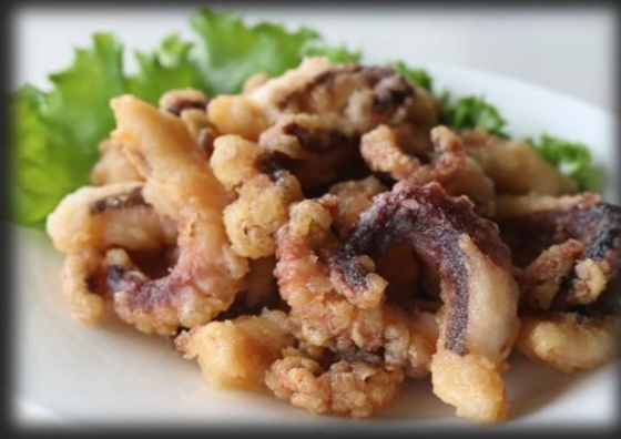
たこの唐揚げ 1,000円(税込 1,100円)