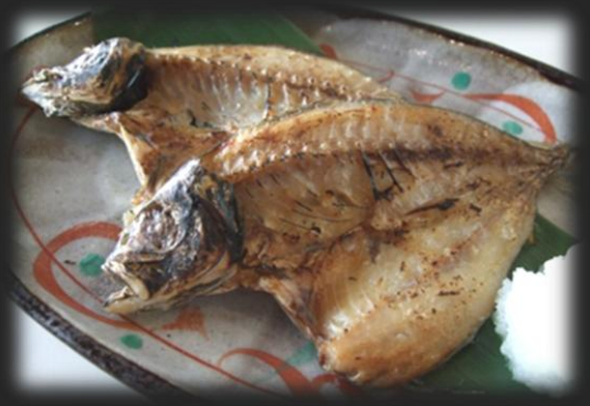
アジの一夜干し(2枚) 1,000円(税込 1,100円)