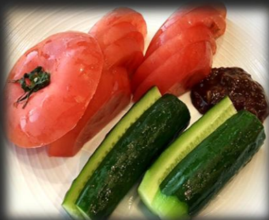
モロキュートマト 800円(税込 880円)