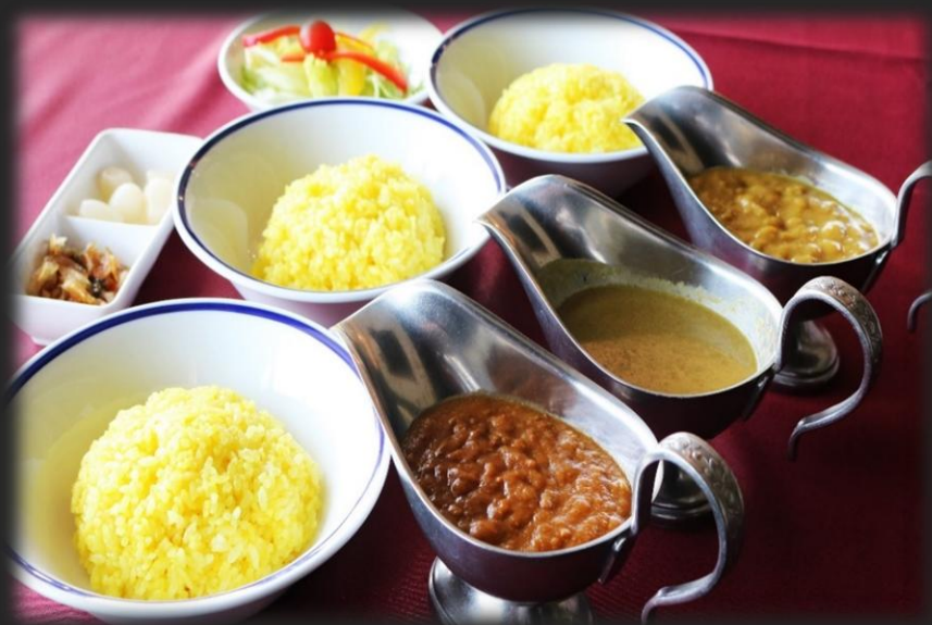
3色カレー 2,100円(税込 2,310円)