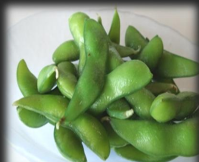
枝豆 800円(税込 880円)