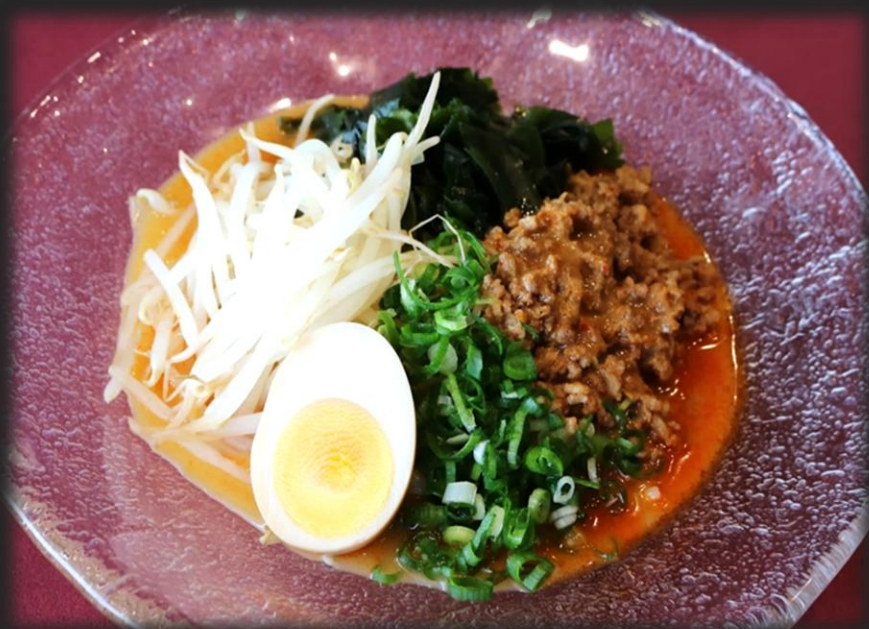
冷やしタンタン麺 1,700円 (税込 1,870円)