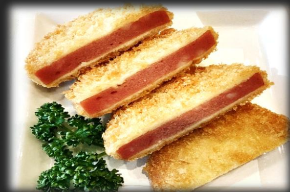
ハムカツ 900円(税込 990)