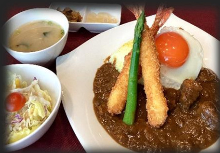
エビフライカレー 2,300円(税込 2,530円)