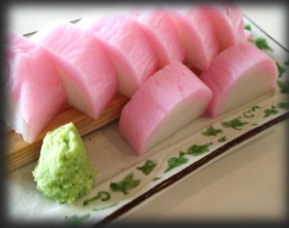
板わさ 800円(税込 880円)