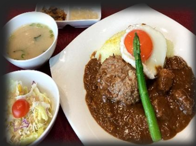
ハンバーグカレー 2,300円(税込 2, 530円)