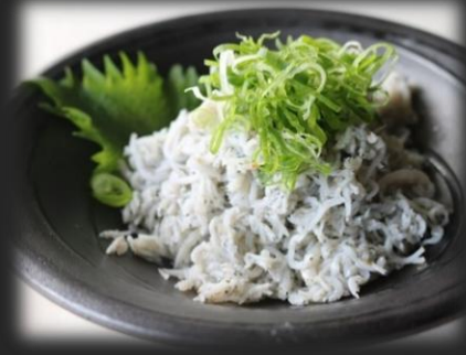
釜揚げしらす(愛媛県産) 800円(税込 880円)