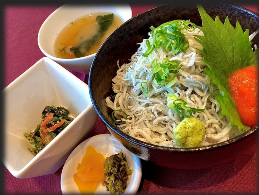
釜揚げしらす丼 1,900円 (税込 2,090円)