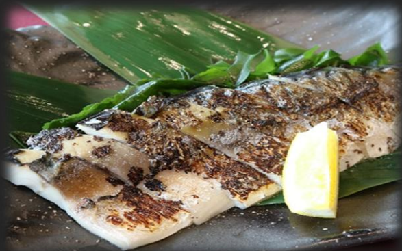
しめ鯖炙り 1,000円(税込 1,100円)