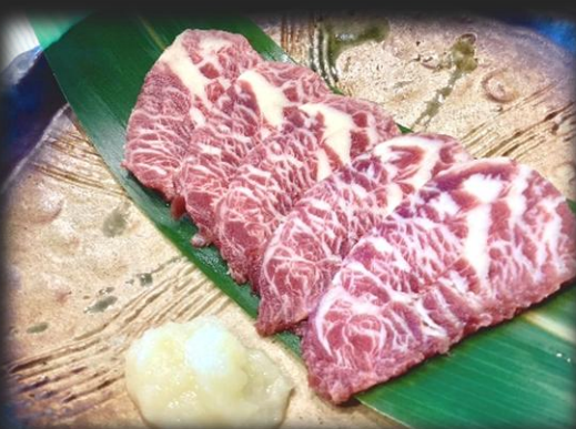
馬刺し 1,000円(税込 1,100円)