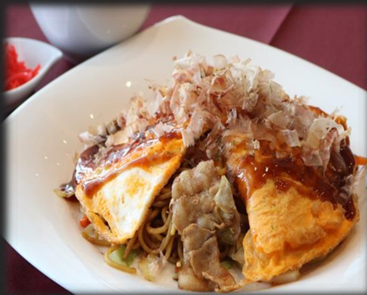
焼きそば 1,600円 (税込 1,760円)