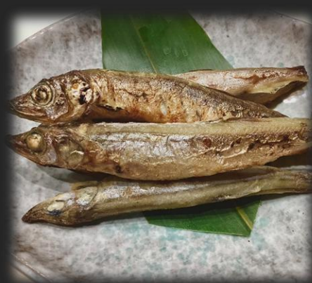
ししゃも 1,000円(税込 1,100円)