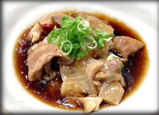
牛すじポン酢 900円(税込 990円)