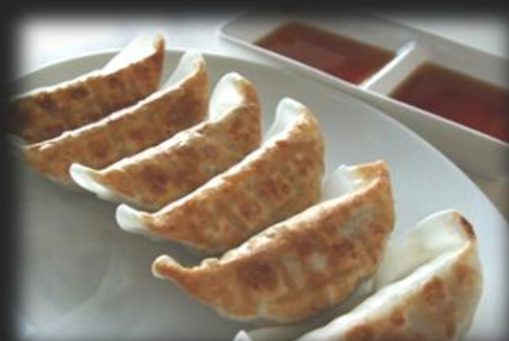
焼きギョーザ 900円(税込 990円)