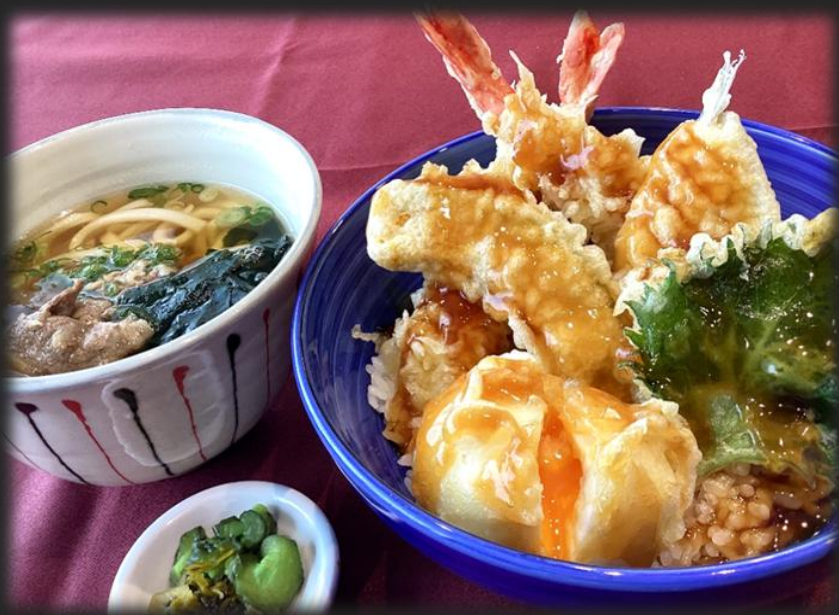
天井 2,200円 (税込 2,420円)