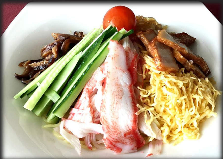
冷麺 1,800円 (税込 1,980円)