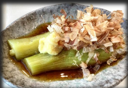
焼きナス 800円(税込 880円)