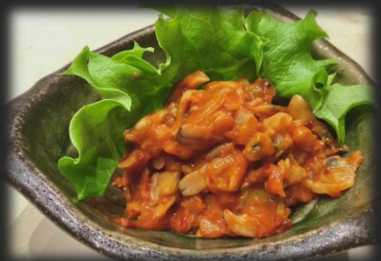
あさりのチャンジャ 800円(税込 880円)