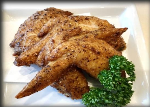
スパイシー手羽唐 1,000円(税込 1,100円)