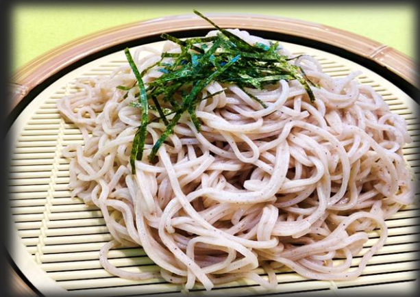
ミニ丼ざるそば(ざるうどん) 1,700(税込 1,870円)