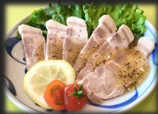
愛媛県産芋豚塩チャーシュー 1,200円(税込 1,320円)