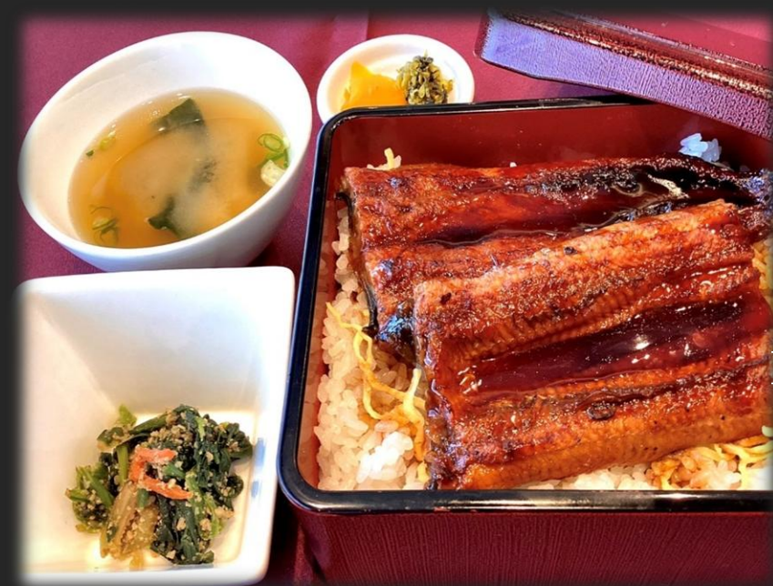
うな重 3,000円(税込 3,300円)