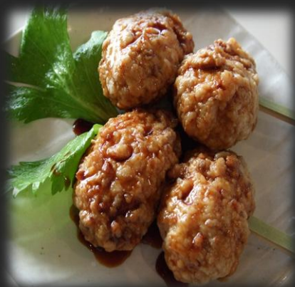
鶏つくね(2串入り) 800円(税込 880円)