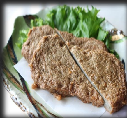
じゃこ天(宇和島産) 800円(税込 880円)