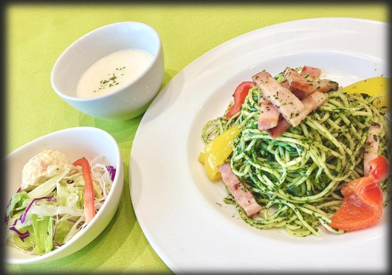
ベーコンとパプリカの ジェノベーゼ 1,800円 (税込 1,980円)