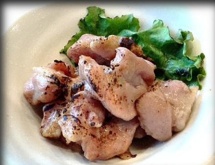
カモの炭火焼き 800円(税込 880円)