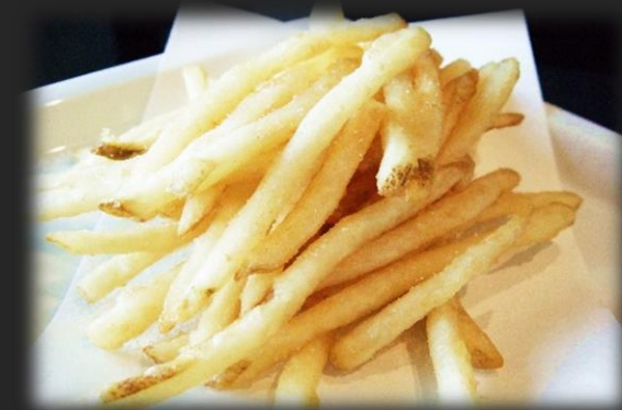
フライドポテト 800円(税込 880円)