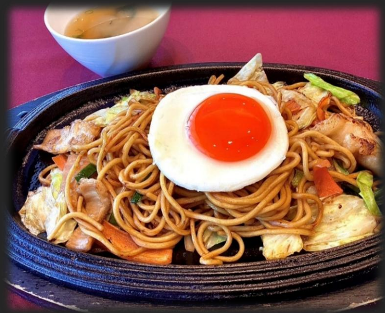
もつ焼きそば 1,900円 (税込 2,090円)