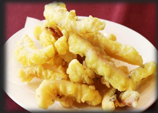
さきいか天 1,200円(税込 1,320円)