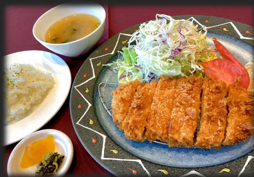
三元豚のトンかつ定食 2,000円 (税込 2,200円)