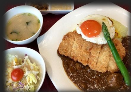
カツカレー 2,400円(税込 2,640円)