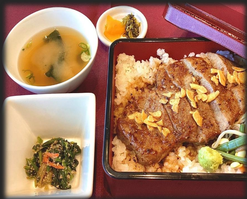
伊予牛A5ランク ステーキ重 2,700円(税込 2,970円)