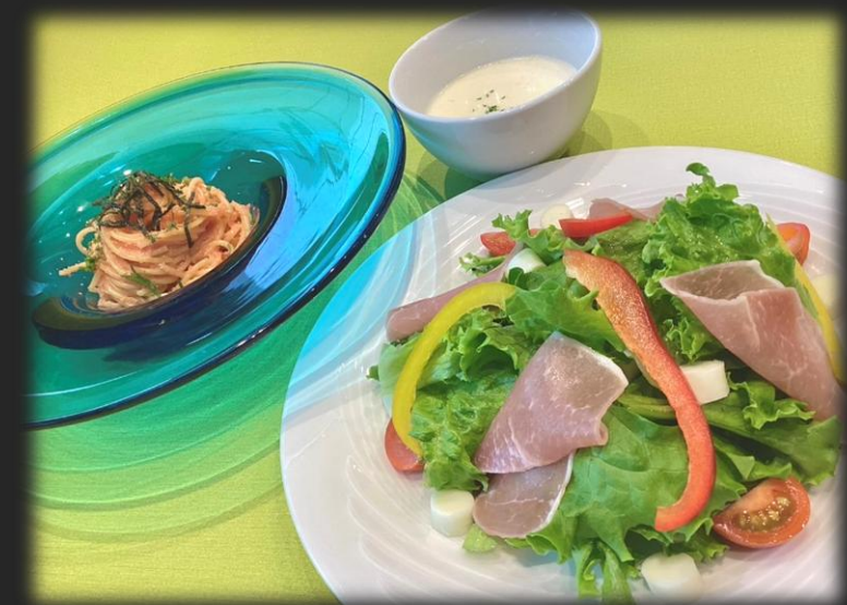
サラダとハーフパスタセット 1,800円 (税込 1,980円)