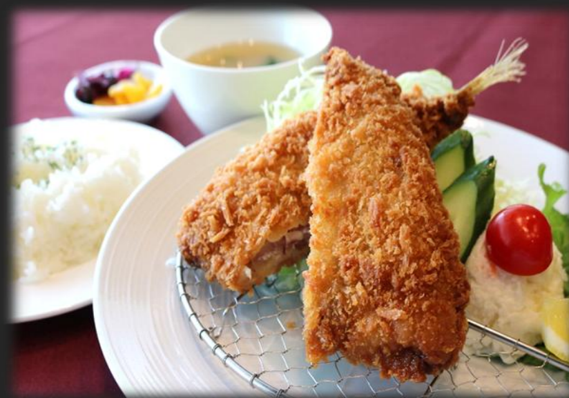
大きなアジフライセット 1,700円 (税込 1,870円)