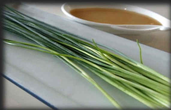
こうとうねぎ 鴨頭ネギ 800円(税込 880円)