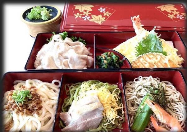
味比べセット 2,000円(税込 2,200円)