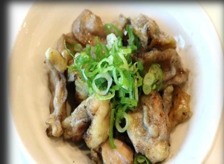
鶏ハラミ焼き 800円(税込 880円)